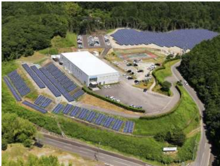
【デンケンが自社工場内に所有するメガソーラー】

共栄九州株式会社と株式会社デンケンは、今後大量に発生するであろう中古の太陽光パネルの有効活用と資源循環を大分県内で実現するため、2023年8月2日付で業務提携いたしました。